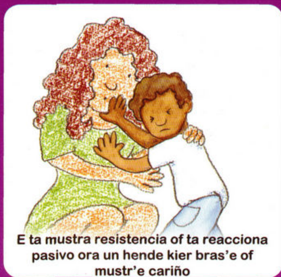
E ta muestra resistencia of ta reacciona pasivo ora un hende kier bras'e of must'r'e cariño